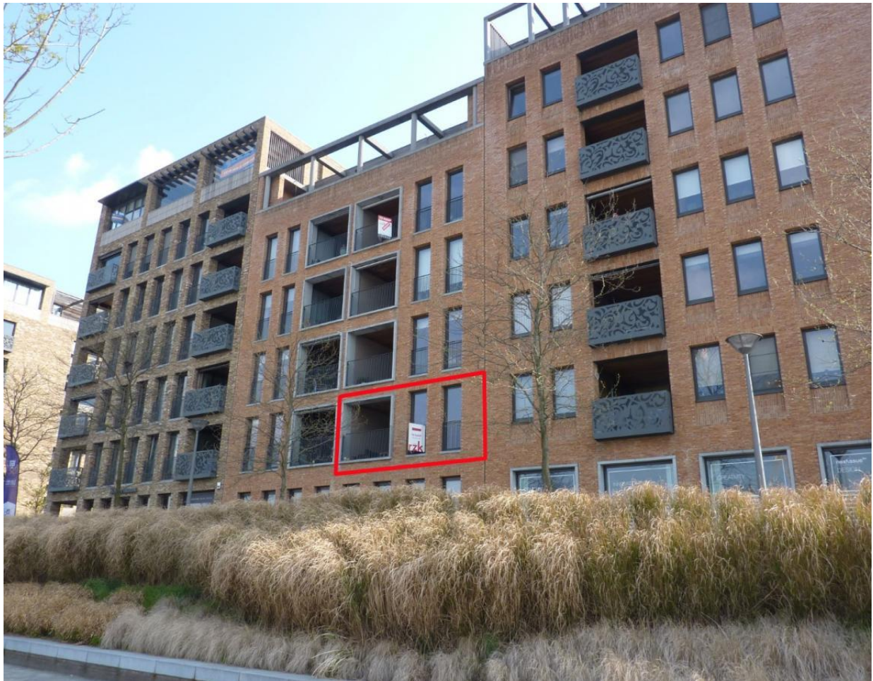
Figuur 2: voorbeeld 'in-pandig terras' (rode kader)